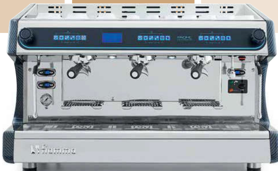
Pacific MB 3 Carbon Fibre

La Pacific Multiboiler permite al barista expresar toda su creatividad, ajustando los parametros a las características de cualquier café, sea de origen o blend, logrando taza tras taza un expreso de calidad.