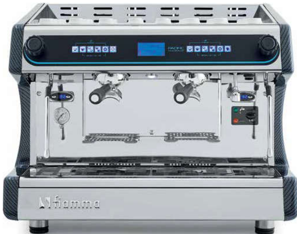
Pacific MB 2 Carbon Fibre

Die Pacific Multiboiler erlaubt es dem Barista, sein kreatives Potential voll auszuschöpfen. Die Temperatur ein jeder Gruppe lässt sich genau abstimmen auf die Charakteristika von Kaffee und Röstung - mit fantastischem Ergebnis in der Tasse!