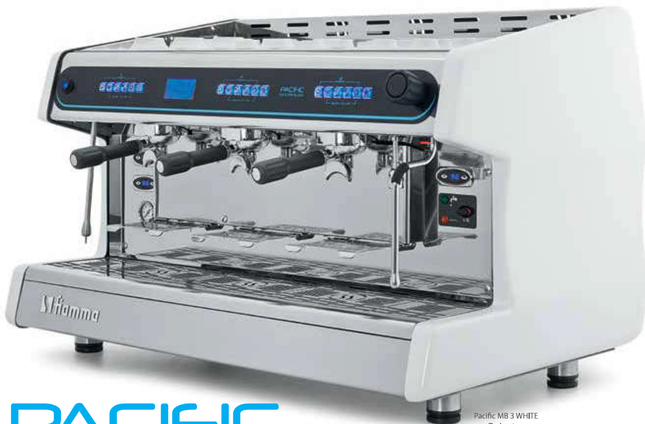
Pacific MB 3 WHITE + Turbosteam