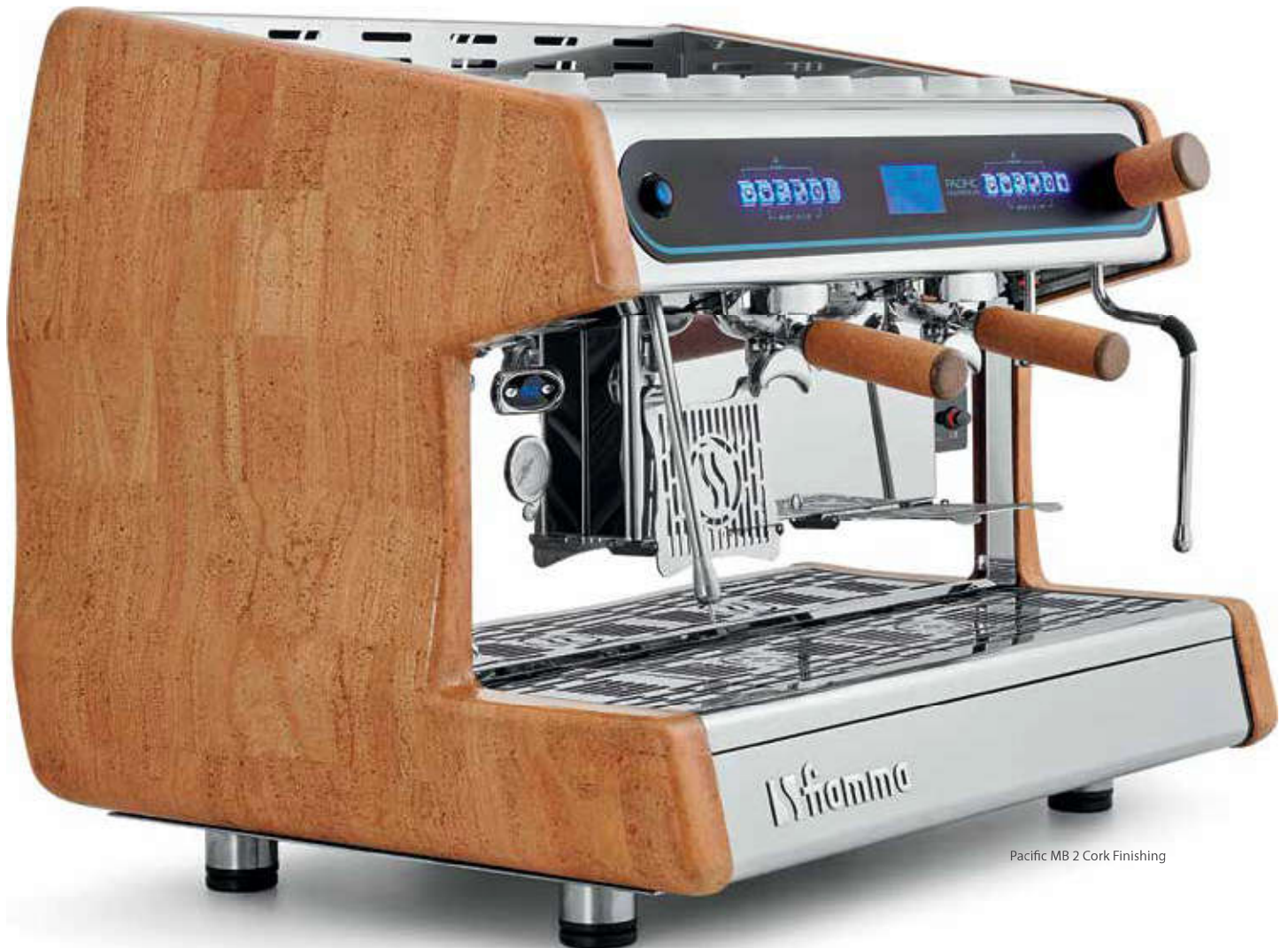
Pacific MB 2 Cork Finishing

Über das Touch-Screen kontrolliert der Barista alle Brühparameter. Die Pacific Multiboiler gibt genaue Kontrolle über die Temperatur im Wasser/Dampfkessel und über die Brühtemperatur des Kaffeewassers an jeder einzelnen Gruppe (Temperaturschwankungen in der Tasse unter 1°C).