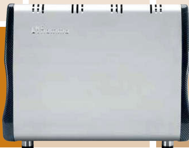
Pacific MB 2

Perfecto para el té. Posibilidad de programar la cantidad y temperatura del agua caliente para el té, en cada grupo