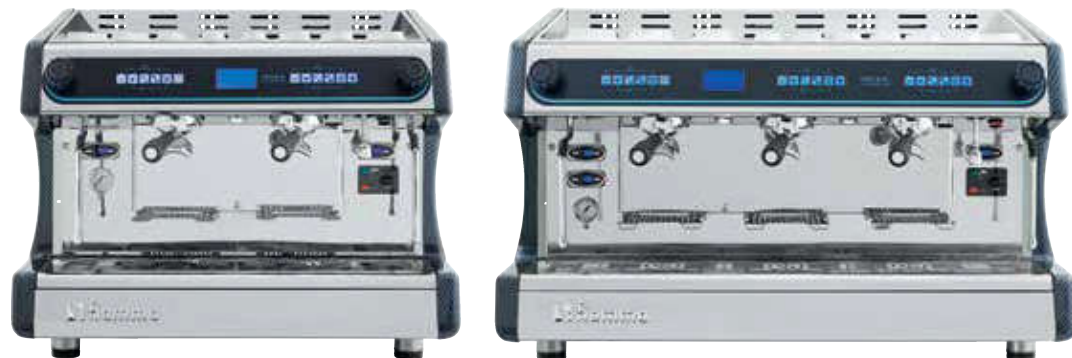
PACIFIC MULTIBOILER 2